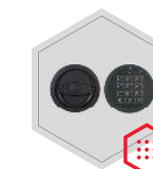
Elektronisches Kombinationsschloss (außer Art. 20000-20001)

Optionale Verschlussvarianten gegen Mehrpreis