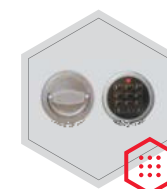
Elektronisches Schloss Stellar Basic