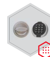
Elektronisches Schloss Primor 3000 level 15