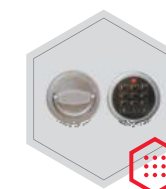
Elektronisches Schloss Stellar Business