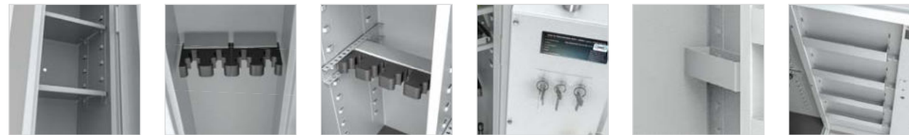
Verstellbares Fachboden Verstellbare Waffenhalter auf Magneten (Schaumstoffhalter 55mm Abstand) Verstellbare Waffenhalter auf Schiene (Schaumstoffhalter 65mm Abstand) Hakenleiste Staufächer Türstaufächer