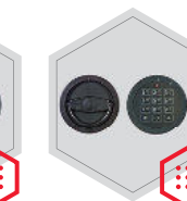
Elektronikschloss kombiniert mit mechanischer Revision