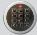
Elektronisches Kombinationsschloss - Solar Business