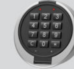
Elektronisches Kombinationsschloss - Primor 3000 level 15