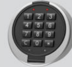
Elektronisches Kombinationsschloss - Primor 3000 level 5