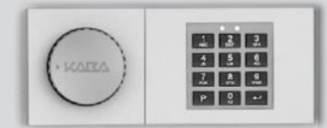
Elektronisches Kombinations- schloss - B 30