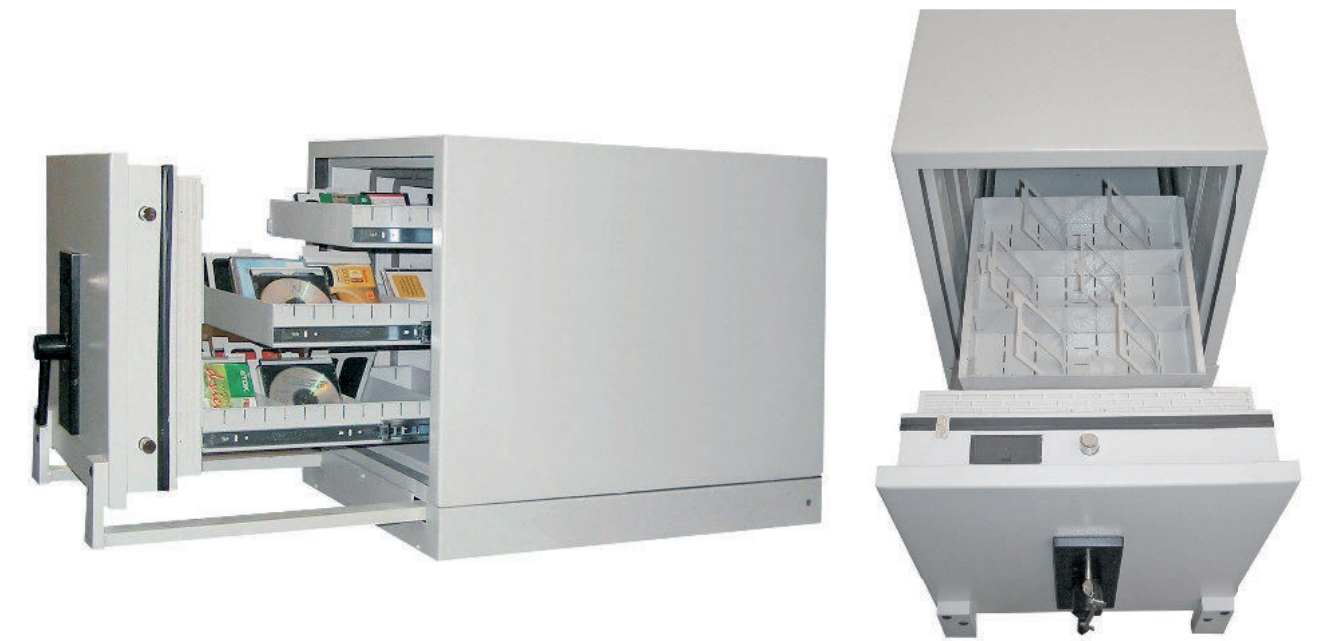
Beispiel für die Anordnung von 3 Schubladen im Oslo - Modell Art. Nr. 46500