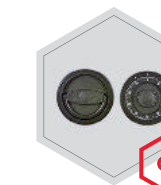
Mechanisches Kombinationsschloss (Ausser Art. 33200- 33201)