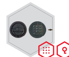
Elektronischschloss kombiniert mit mechanischer Revision (Ausser Art. 33200-33201)